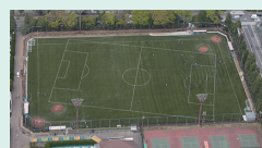
▲世田谷公園サッカー場

陸上競技場をはじめ、野球場やテニスコート、学校の校庭などの施設を作っています。特に最近では、スケートボード専用の施設もたくさん作っています。