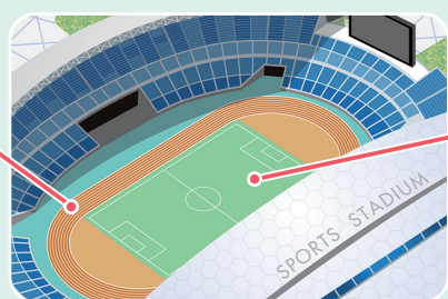
陸上競技場&サッカー場